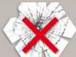
Vitre ou verre brisé