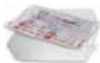
Films en plastique enveloppant les revues