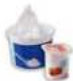
Pots en plastique