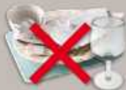
Vaisselle, faïence, porcelaine