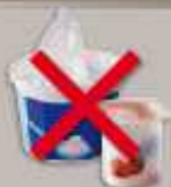
Pots en plastique