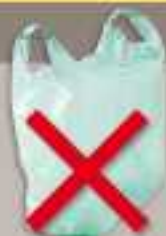
Films et sacs plastiques