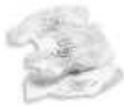
Papiers salis ou gras

✓ A déposer dans les filières spécifiques