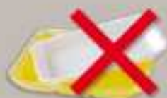
Barquettes en polystyrène