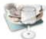
Vaisselle, faïence, porcelaine